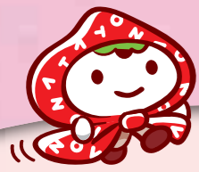
南砺里山博イメージキャラクター SATOちゃん