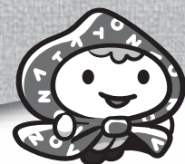
南砺里山博イメージキャラクター SATOちゃん

南砺里山博2011夏編で南砺を見て回って頂ける4種類のパンフレットを制作しました。